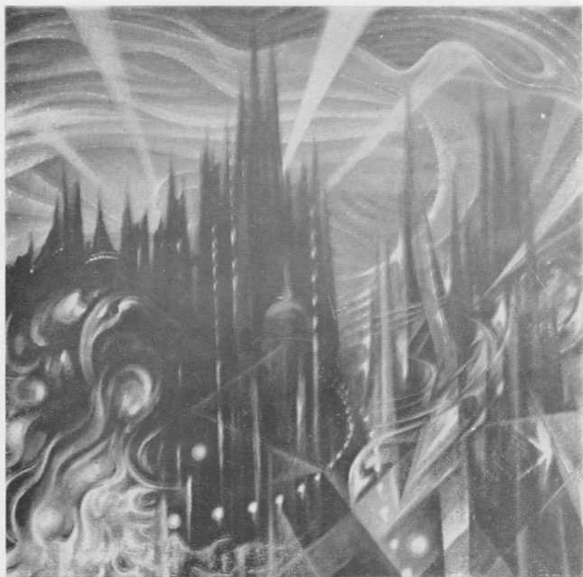
N.º 21. — La Ciudad Alucinada