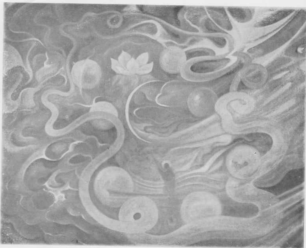
N.º 4. — La Ronda de los 7 Mundos