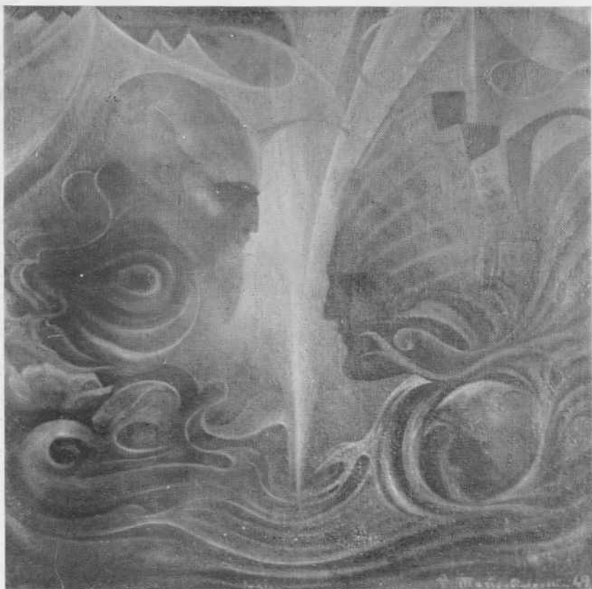
N.º 13. — El Mensaje