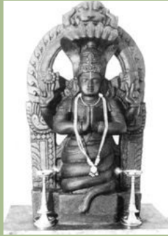
- Representación hindú de Patanjali-