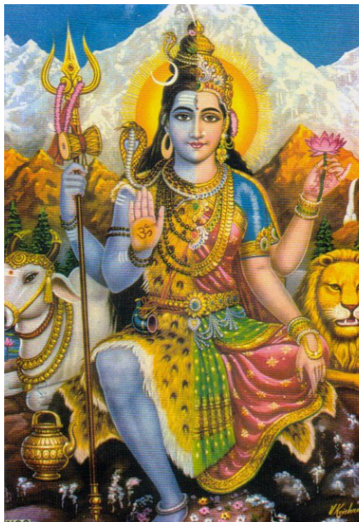
Imagen de Ardhanarishvara, deidad hindú que representa la síntesis de las energías masculinas y femeninas del universo, expresiones simbólicas de Purusha y Prakriti, como la forma andrógina del dios Shiva y su consorte Parvati. Ilustra cómo, en la raíz de la creación, el principio femenino de Dios, Shakti, es inseparable de Shiva, el principio masculino.

Se comenzará el estudio tocando aspectos que pudieran considerarse abstrusos o complicados, pero que servirán de base sólida para el desarrollo posterior del tema. Se comenzará tratando de la simbología que se encuentra en el Proemio de La Doctrina Secreta. La primera figura es un disco sencillo \bigcirc . La segunda representa en el símbolo arcaico, un disco con un punto en el centro \odot , la diferenciación primera en las manifestaciones periódicas de la Naturaleza eterna, sin sexo e infinita. En su tercera etapa, el punto se transforma en un diámetro \ominus . Entonces simboliza a una Madre Naturaleza inmaculada y divina, en el infinito absoluto. Cuando el diámetro horizontal se cruza con uno vertical el símbolo se convierte en la cruz mundana \oplus .